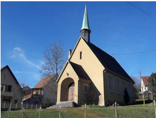
Le temple de Soultz

Ancrée dans le Florival, notre paroisse dispose de deux temples. Le temple de Guebwiller date de 1824. Un processus de rafraîchissement intérieur est à engager à partir de 2024, année de son bicentenaire. Le temple de Soultz, inauguré en 1937, non chauffé, n'accueille pas actuellement de vie communautaire propre mais permet d'envisager des propositions alternatives, notamment des cultes à d'autres horaires, avec une forme différente ou des projets culturels ou artistiques.