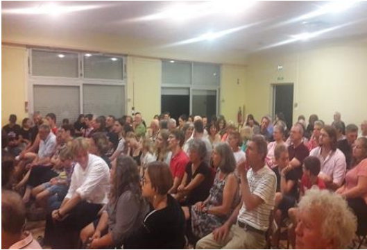
Une soirée en partenariat avec le Cercle St-Michel d'Issenheim

La paroisse participe activement à la vie sociale et culturelle de son territoire et met ses locaux régulièrement à disposition d'autres associations, ainsi que pour des événements familiaux. Elle contribue à l'animation patrimoniale et touristique en ouvrant régulièrement le temple aux visites ou à des manifestations extérieures. Elle développe des partenariats avec les associations culturelles et diaconales de son territoire.