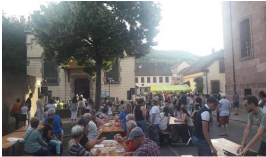
La paroisse organise la Fête de la Musique avec l'EECG

La paroisse fait partie du secteur « Vosges » du Consistoire réformé de Mulhouse et à ce titre entretient une pastorale de secteur avec les paroisses de Cernay et Thann-Felling, notamment par des échanges de chaire et l'organisation commune du catéchisme. Voisine de la paroisse d'Ensisheim relevant de l'Inspection luthérienne de Colmar, elle entretient avec elle des relations fraternelles. Elle a des relations fortes avec les autres Églises au sein de