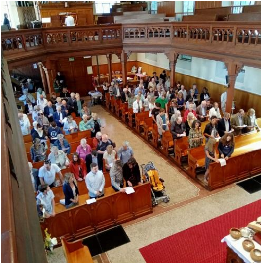
Un temple chaleureux où il fait bon se retrouver

C'est là que se rencontrent les joies et les peines, que se confrontent les diverses lectures individuelles et que chacun prend conscience de son unicité au sein d'une communauté. C'est là aussi que se forge l'orientation d'une vie fondée sur l'Évangile dans la perspective du Royaume de Dieu. Plutôt qu'un « service divin », le culte fait de l'homme un serviteur de l'Éternel par le service inconditionné de son prochain. Ainsi le culte est une prière collective où chacun demande à être transformé à l'image de Dieu et en d'autres termes à devenir toujours plus humain.