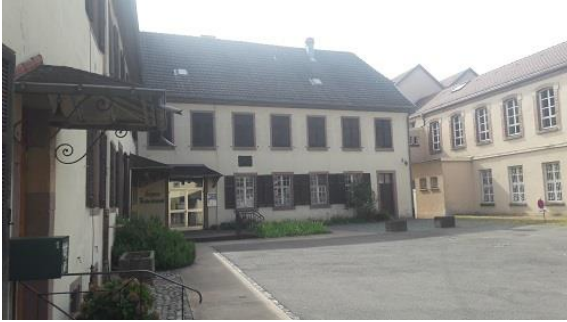
Le foyer paroissial, un outil d'animation et d'accueil

Ainsi d'origine zwinglienne et calviniste de tendance libérale comme l'étaient ses fondateurs, la paroisse est aujourd'hui le lieu de communion entre diverses théologies. Cette diversité est une caractéristique forte de la paroisse. Il est essentiel de veiller à cette fraternité entre lectures et pratiques différentes. De même qu'un écosystème a besoin d'une biodiversité pour répondre aux évolutions de son environnement, une paroisse a besoin