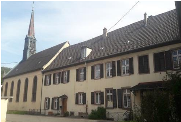
Un ensemble paroissial cohérent

De sa fondation en 1805 par les industriels protestants venus de Mulhouse ou de Suisse, lui vient une spiritualité réformée classique considérant le monde comme étant le « théâtre de la gloire de Dieu » 3 . De même, elle insiste sur la nécessaire cohérence entre vie personnelle et confession au sens où « Être chrétien, ce n'est pas parler du Christ mais c'est vivre comme lui » 4 . Elle assume ainsi son origine liée au protestantisme réformé dans sa